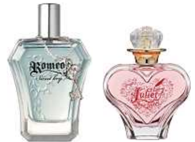
レディスフレグランス 『ジュリエットラブレター』への アンサーフレグランスです。

ジュリエットの心を一瞬にしてとろけさせる魅力の持ち主、ロミオ。 いつの時代も、 女の子はそんなスウィートな男を求めている！ だから今すぐ、“男の可愛さ”をまとめて、賢くモテろ！