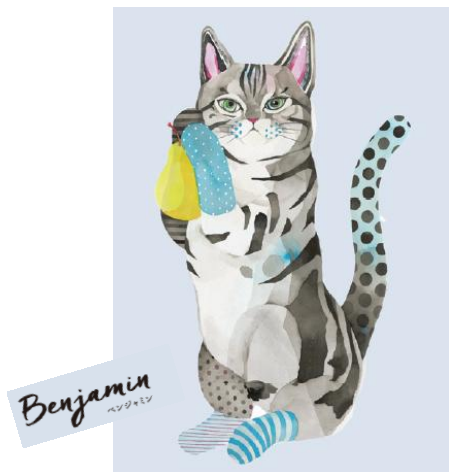
のんびり気ままないたずら子猫 “ベンジャミン”

パフュームスティックを彩るのは、可愛らしく個性的な動物たち。みんな自慢の名前をもっています。それぞれが持っていたり身につけているのは、香りのキーとなる、自分の大好きなアイテム。