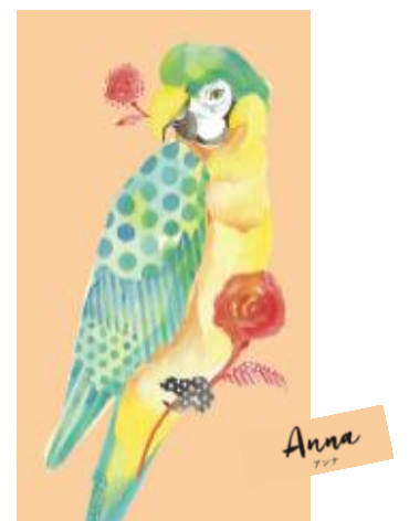
自由に羽ばたくハッピーバード “アンナ”