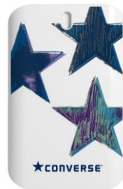
ネイビー シトラスコットン香り