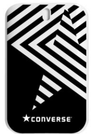
オールブラック クリーミーバニラの香り