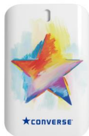
オフホワイト フルーティーフローラル香り