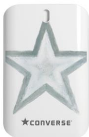
ホワイト ピュアシャボン香り