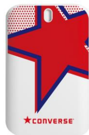
レッド フローラルベリー香り