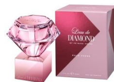
ロードダイヤモンド バイ ケイスケ ホンダ オードパルフラム（プールファム）