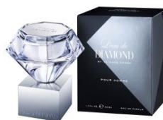
ロードダイヤモンド バイ ケイスケ ホンダ オードパルフラム（プールオム）