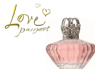
ラブパスポートフローティブリス オードパルファム スプレー