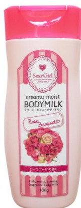
クリーミーモイスト ボディミルク ローズブーケ