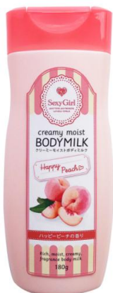
クリーミーモイスト ボディミルク ハッピーピーチ