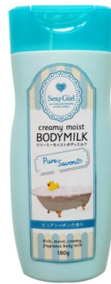
クリーミーモイスト ボディミルク ピュアシャボン