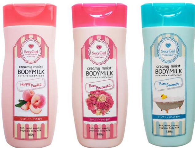
セクシーガール クリーミーモイスト ボディミルク ハッピーピーチ／ローズブーケ／ピュアシャボン 各 180g 1,050 円(税込)