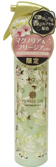
ヴィーナススパ カプセルヘアフレグランス マグノリア&フリージア

2014年10月4日(土)、100万本突破の大ヒットヘアフレグランスシリーズ ヴィーナススパより、昨年発売し大ヒットを記録した【マグノリア&フリージアの香り】を数量限定で再発売いたします。 上品な甘さを持つマグノリア(モクレン)とフリージア。 華やかな幸福感あふれるフルーティフローラルウッディの香りを今年の冬も是非お試しください。