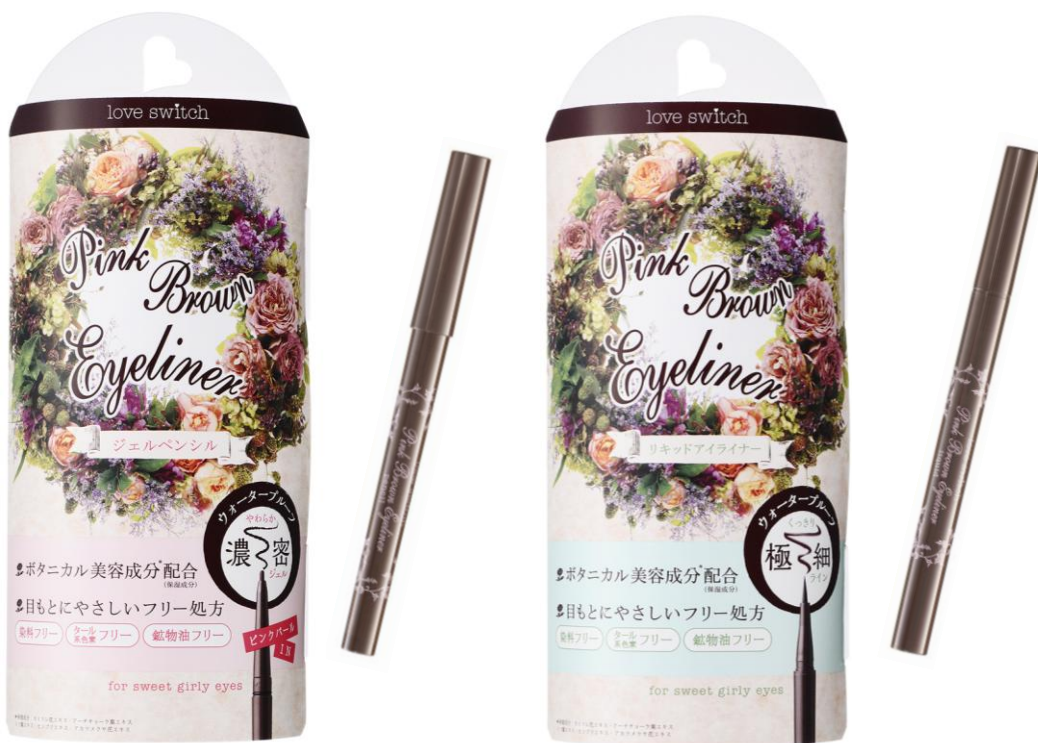
ラブスイッチ ピンクブラウン ジェルペンシルアイライナー／ピンクブラウン リキッドアイライナー 各 1,200 円(税抜)

※カミツレ花エキス、アーチチョーク葉エキス、シソ葉エキス、センブリエキス、アカツメクサ花エキス