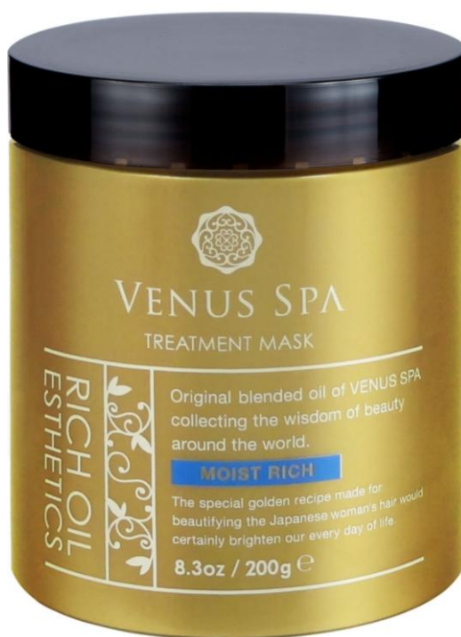
ヴィーナススパ 濃密オイル マッサージヘアマスク 220g

2014年11月22日、ヴィーナススパより洗い流すスペシャルダメージケア 「濃密オイルリッチオイル マッサージヘアマスク」を新発売いたします。 ノンシリコンでオイル配合なので こっくり・濃厚なヘアマスクが乾燥・カラーリング・パーマなどのダメージを集中補修します。 8種の天然オイルとサロン発の最新成分「メドウラクトンVE」の力に加え、 地肌をすこやかに保つオリエンタル美容成分「ショウガ根エキス」を配合。 ノンシリコンのヘアマスクで満足できなかった方にも是非おすすめしたいスペシャルケアです。