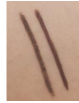
左: 通常ピンクブラウン 右: 桃プロデュース のピンクブラウン

通常のピンクブラウンよりも深く濃い発色で ナチュラルだけどぼやけずくっきり！ 肌になじむ女性らしいほどよい赤みでふんわり可愛い印象に。