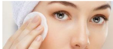
コットン拭きとり洗顔として