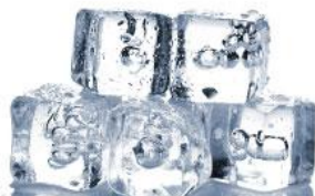
冷蔵庫で冷やしてお肌をキュッ