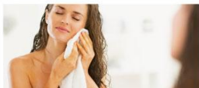
お風呂上がりの瞬感保湿