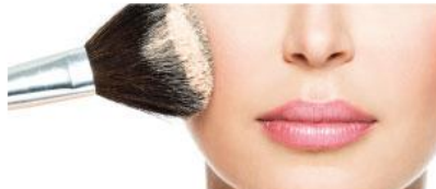
パウダーファンデーションの 仕上げに