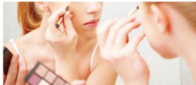
メイク直しにひと吹き