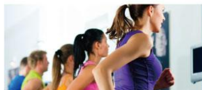
スポーツ後のリフレッシュに