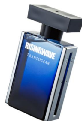
ライジングウェーブ トランスオーシャン オードトワレ