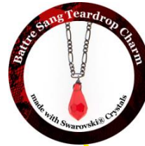
Battre Sang Teardrop Charm made with Swarovski® Crystals