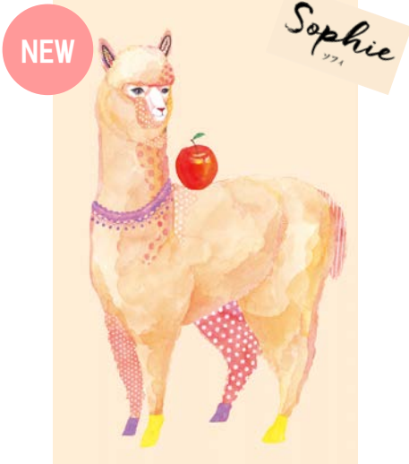
ほんわか天然マイペース “ソフィ”

パフュームスティックを彩るのは、可愛らしく個性的な動物たち。みんな自慢の名前をもっています。それぞれが身につけているのは、香りに含まれている、自分の大好きなアイテム。