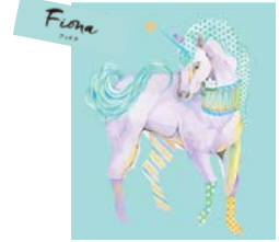
夢を叶えるフェアリーテール “フィオナ”