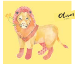
クールで優しい照れ屋さん “オリバー”