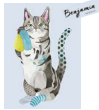
のんびり気ままないたずら子猫 “ベンジャミン”