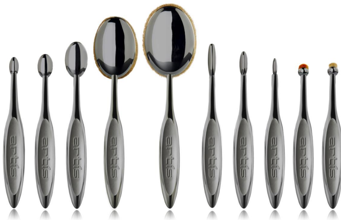
<アーティス メイクアップブラシ エリートコレクション スモーク>