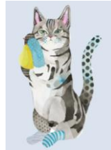
のんびり気ままないたずら子猫 “ベンジャミン”