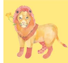
クールで優しい照れ屋さん “オリバー”