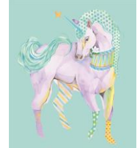
夢を叶えるフェアリーテール “フィオナ”