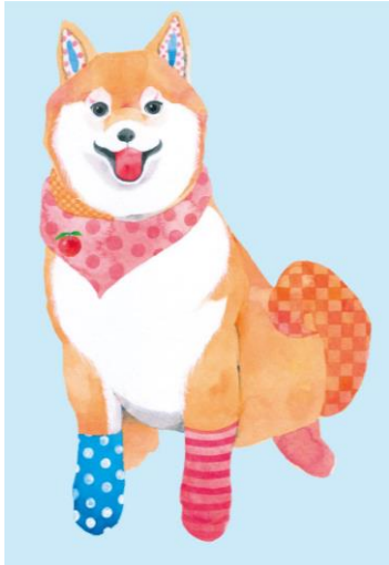
愛嬌たっぷりわんぱくボーイ “コタロー”

パフュームスティックを彩るのは、可愛らしく個性的な動物たち。みんな自慢の名前をもっています。それぞれが身につけているのは、香りに含まれている、自分の大好きなアイテム。国内外で活躍するイラストレーター Cato Friend さんの描き下ろした、幻想的でモダン、生命力あふれる動物たちです。