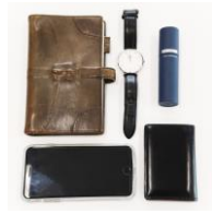
いつでも持ち運べる!