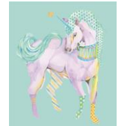
夢を叶えるフェアリーテール “フィオナ”