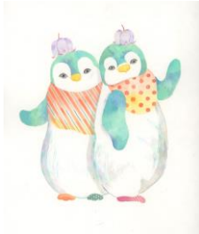
いつも一緒に仲良しツインズ “ティム&トム”

パフュームスティックを彩るのは、可愛らしく個性的な動物たち。みんな自慢の名前をもっています。それぞれが身につけているのは、香りに含まれている、自分の好きなアイテム。国内外で活躍するイラストレーター Cato Friend さんの描き下ろした、幻想的でモダン、生命力あふれる動物たちです。